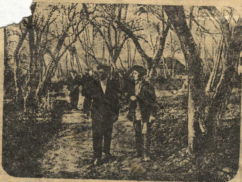
Парк культуры и отдыха открыт в колхозе им. Академии Крупской (Желтухинский р-н, Моск. обл.). В парке сооружена спортплощадка и строится помещение для театра. На снимке: Колхозники на прогулке в парке.